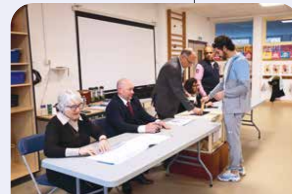
Les électeurs étaient appelés aux urnes sur les 10 bureaux de votes (ici le n°9, Monnet-Schuman).